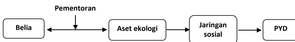
Rajah 2: Kerangka konseptual dapatan kajian

Melalui pementoran, golongan belia mempunyai peluang untuk membangunkan kemahiran, membentuk kepimpinan belia dan penerusan serta pengekalan hubungan antara golongan belia (protégé) dan dewasa (mentor).Kelebihan yang diperolehi golongan belia melalui pementoran kepimpinan dapat dikaitkan dengan kriteria pembangunan belia yang efektif.Secara jelasnya, pementoran telah membuka peluang kepada pemimpin belia untuk mendapatkan akses melalui aset ekologi melalui komuniti yang disertai mereka dan secara langsung membangunkan elemen jaringan ( connection ) dalam PYD dengan membentuk kepimpinan tanpa partisan dan memimpin perubahan sosial. Rajah 2 berikut adalah kerangka konseptual yang dapat dibentuk daripada dapatan kajian dan perbincangan dalam kajian ini.